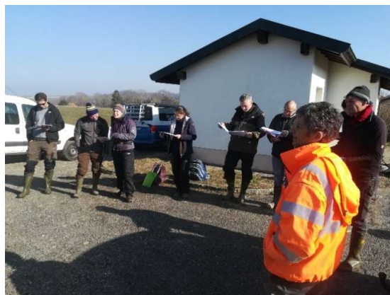
Teilnehmende erhalten eine Einführung

Ziel des Anlasses war das Testen einer möglichst objektiven Beschreibung von Redoxmerkmalen in Bodenprofilen im Zusammenhang mit der Rev. KLABS/KA.