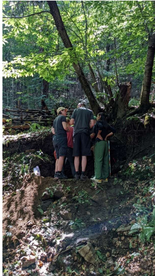
Teilnehmende vor dem Aufschluss