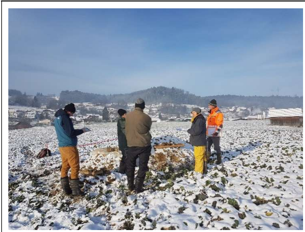
Abgleichstag bei eisigen Temperaturen