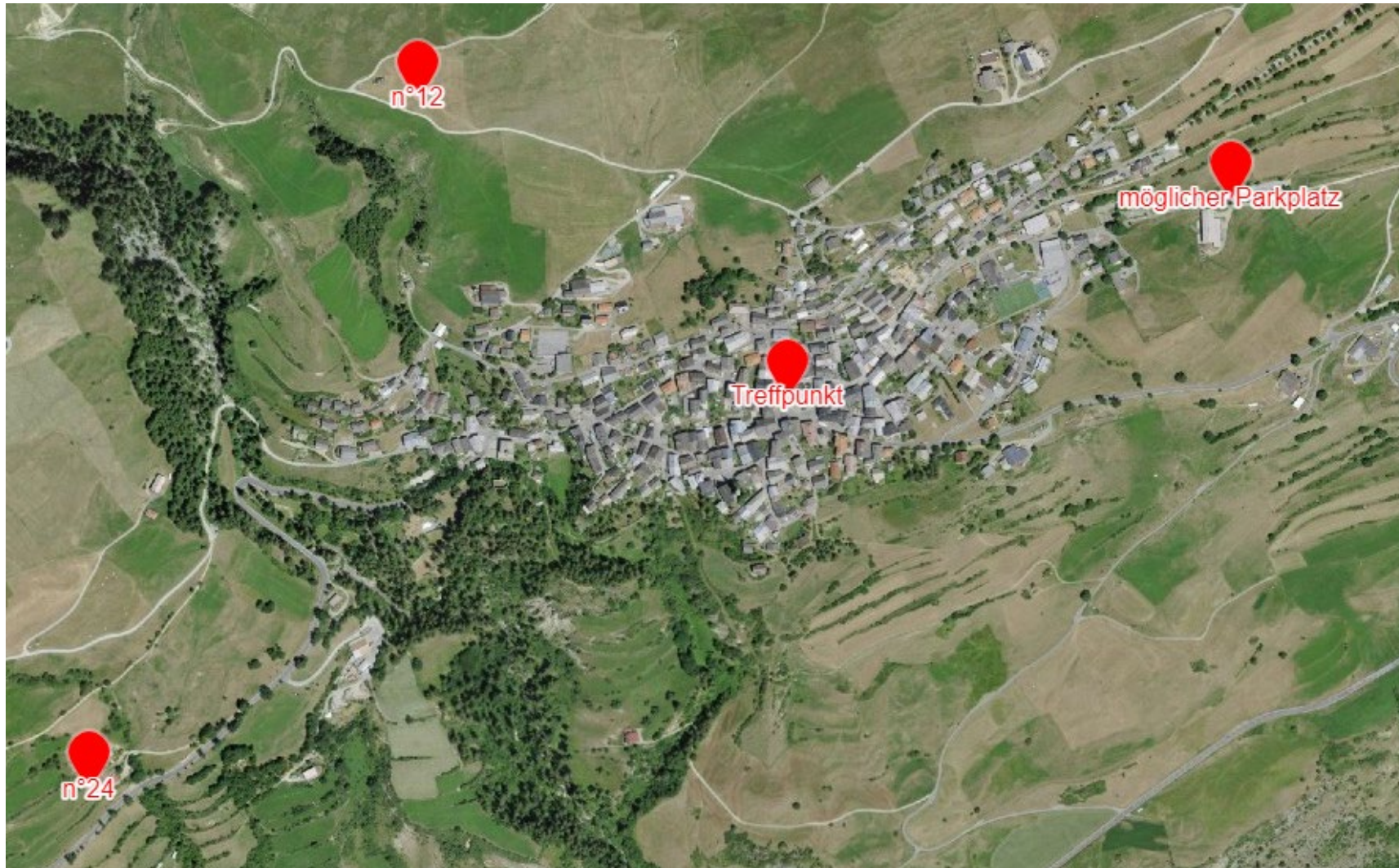
Abbildung 2: Übersicht Sent. Treffpunkt: Bushaltestelle Sent, Platz